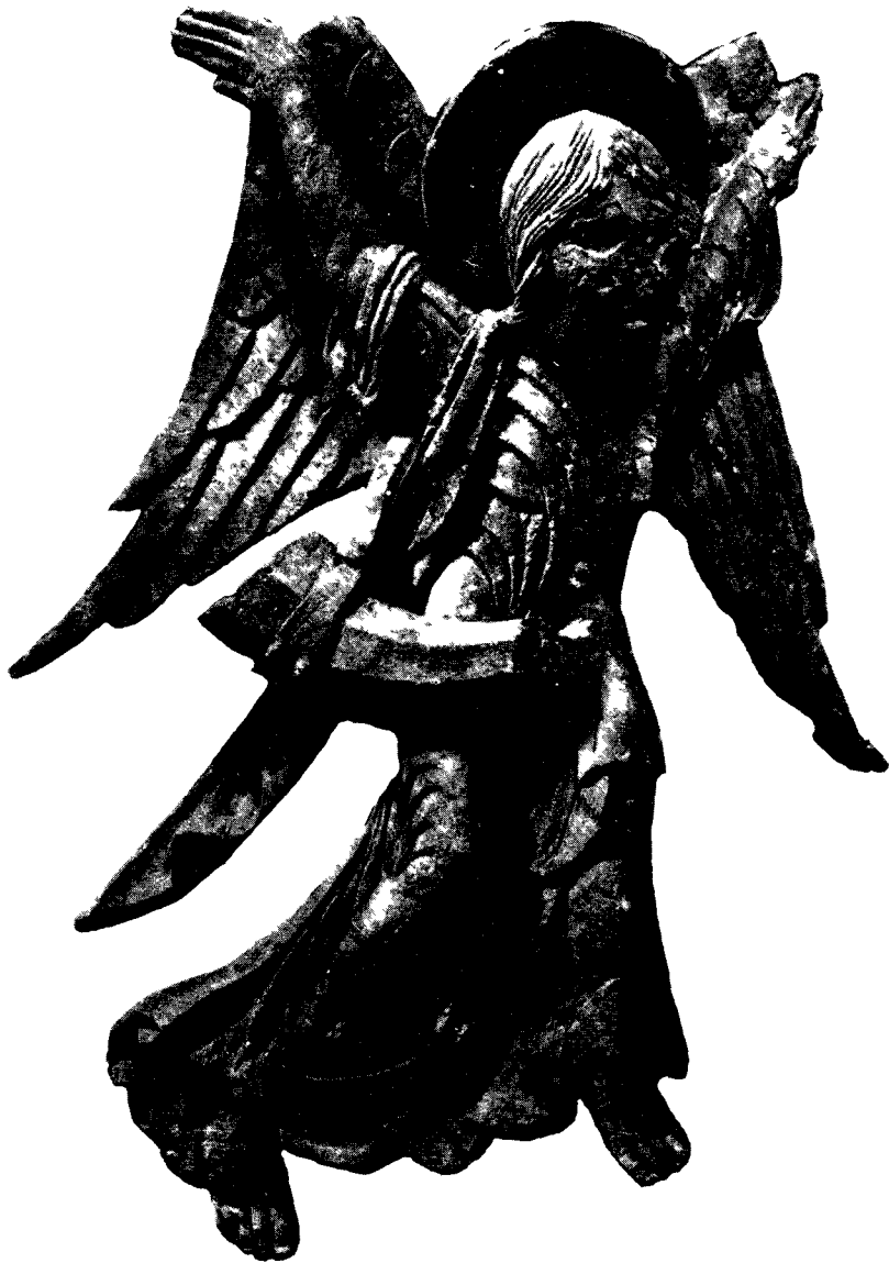
Angel de la resurreccion de Vezelay