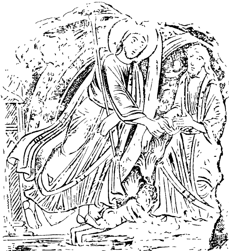
Cristo en los Limbos - Iglesia de San Clemente de Roma